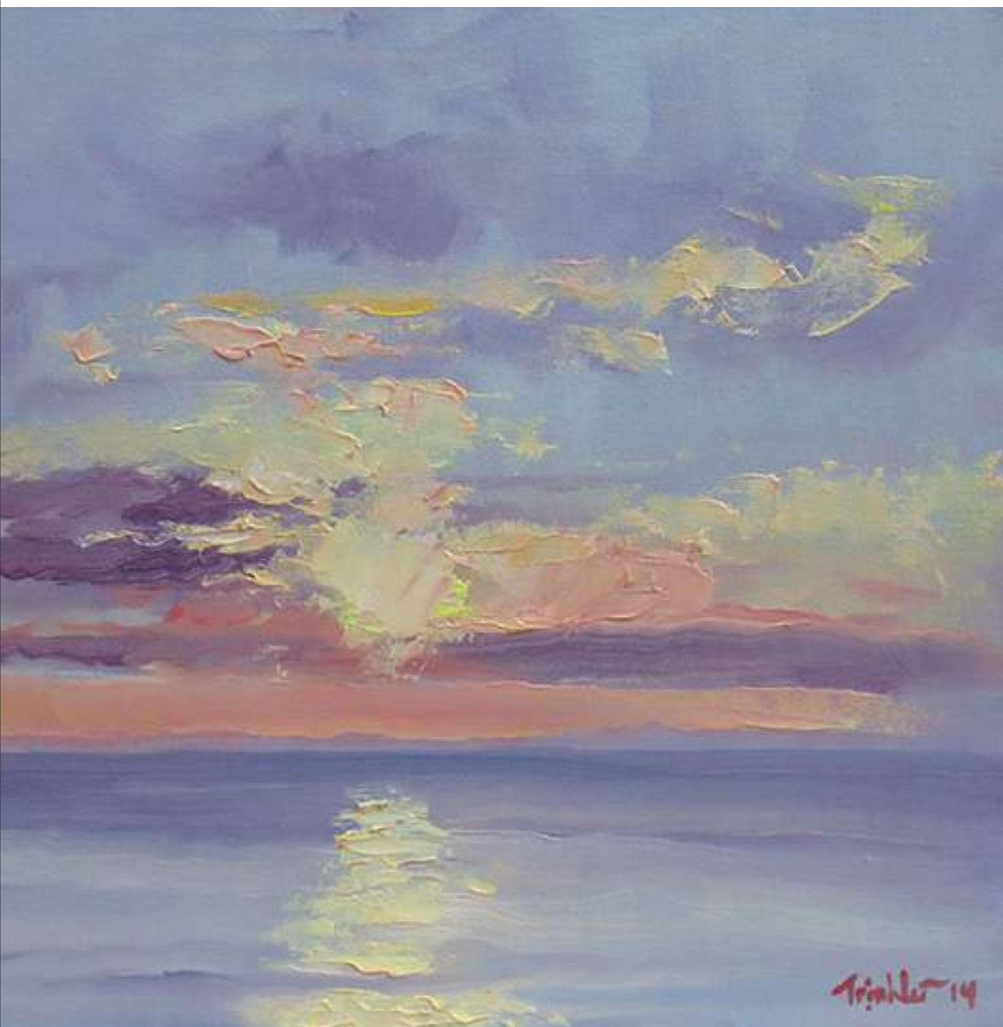
Rạng ngày , 28 × 35,5 cm – sơn dầu trên Utrecht canvas panel