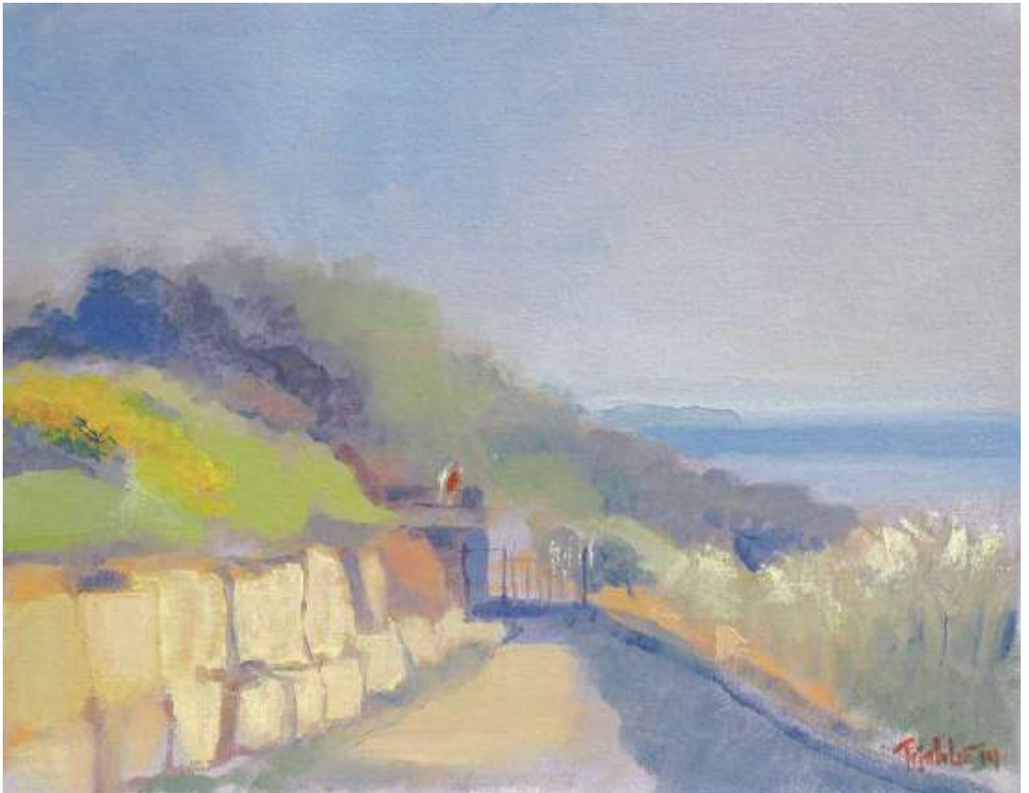
Nắng sớm đầu hè , 28 × 35,5 cm – sơn dầu trên Utrecht canvas panel