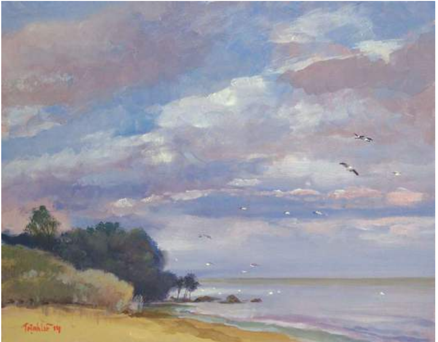
Sắp tối , 28 × 35,5 cm – sơn dầu trên Gessobord