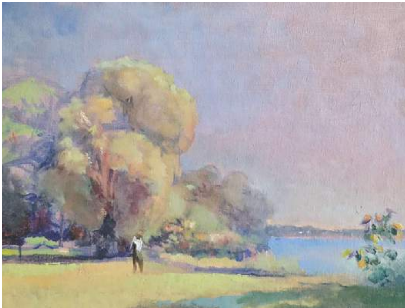
Người từ trong cảnh bước ra, 23 x 30 cm – sơn dầu trên Utrecht canvas panel

Bà bảo với ông kia rằng “Tuan also agrees with me that we should not cut down these trees and plants...” Chẳng là trước đó mình có trao đổi với bà đôi chút về vẻ đẹp sang quý của cây cỏ và rất bất bình khi bà nói có thể dân làng sẽ đòi phát bớt rặng cây vừa vẽ vào tranh của mình.