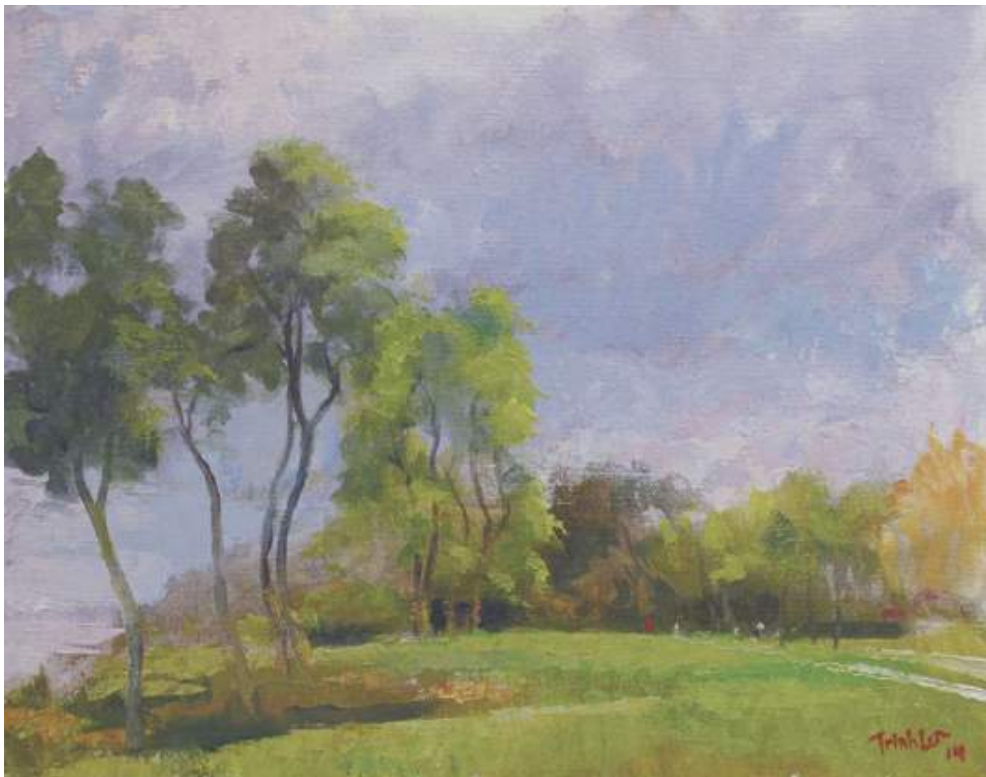
Nắng muộn chiều hè , 28 × 35,5 cm – sơn dầu trên Utrecht canvas panel

Tốn mất gần 5 đô la mua một cuộn Velcro loại “industrial strength” dùng cả ngoài trời lẫn trong nhà. Giờ thì cái ba lô liền ghế đựng đồ vẽ ấy có thể tháo lắp chắc chắn lên xe mà không cần chằng buộc gì cả, chỉ ba tiếng “click” là xong.