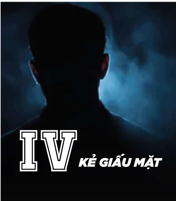
IV KẺ GIẤU MẶT