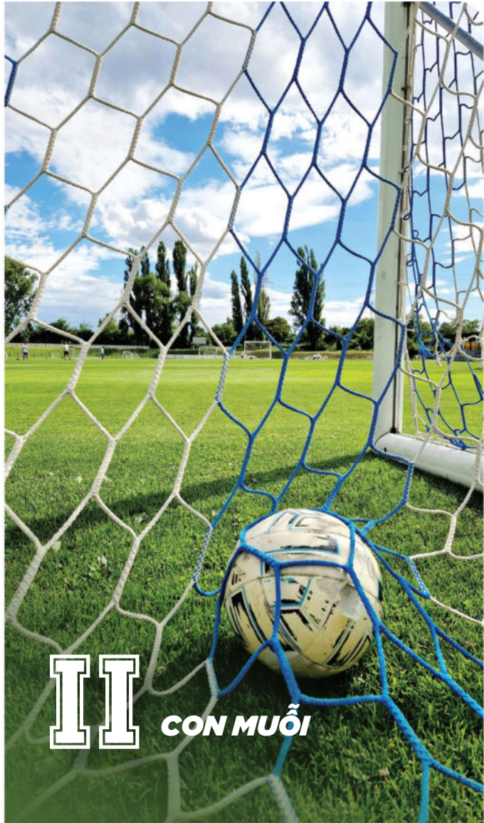
II CON MUỖI