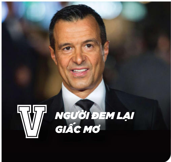
V NGƯỜI ĐEM LẠI GIẤC MƠ